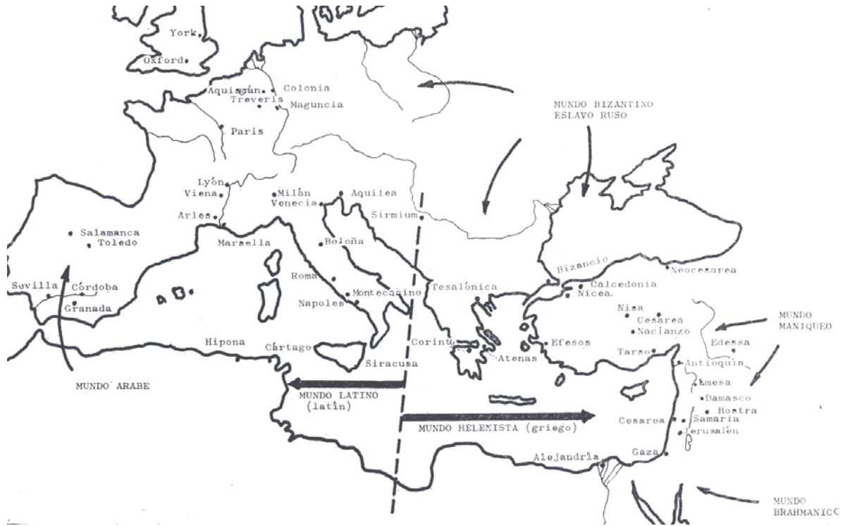
2-MAPA DEL MEDITERRÁNEO BIZANTINO-LATINO